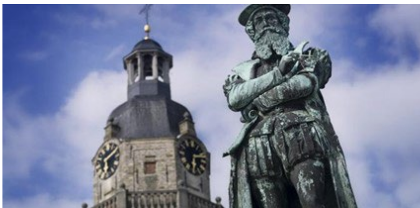
Het standbeeld van Gerard De Cremer (Mercator) te Rupelmonde

Alle last-minute info, inclusief definitieve afstanden en rustposten zijn te vinden op de website van Wandelclub De Lachende Klomp: www.delachendeklomp.be